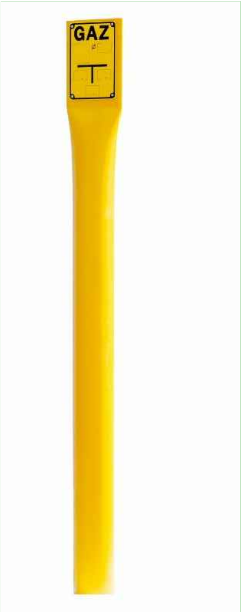
Rys. 1 Słupek oznaczeniowy: - wykonany z polietylenu, - wysokość 1,5m, - mocowany za pomocą kotwy gruntowej, - zagłębienie 0,8m, - średnica 110mm.